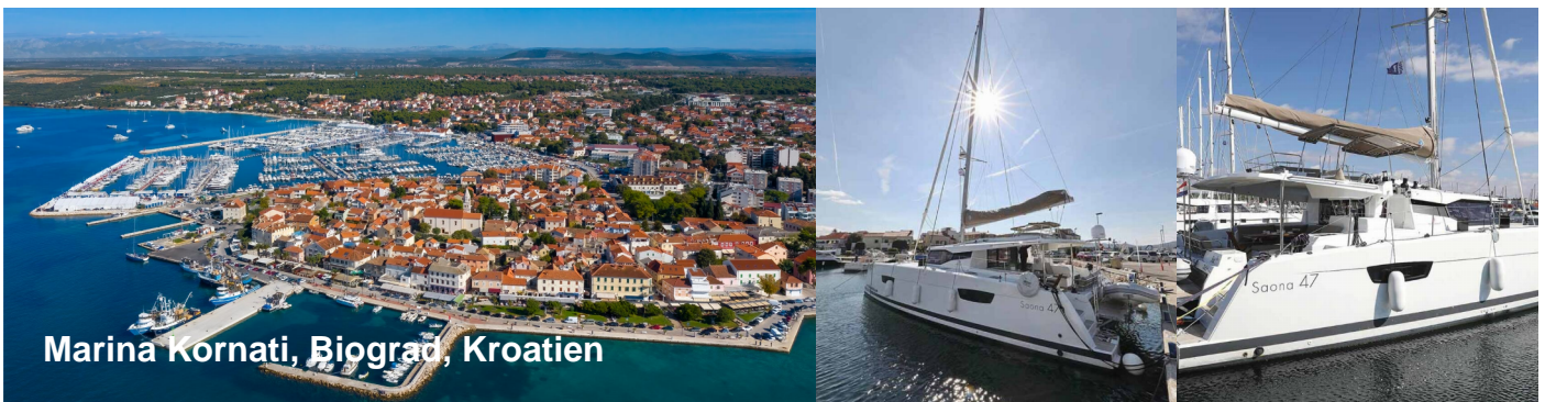
Marina Kornati, Biograd, Kroatien