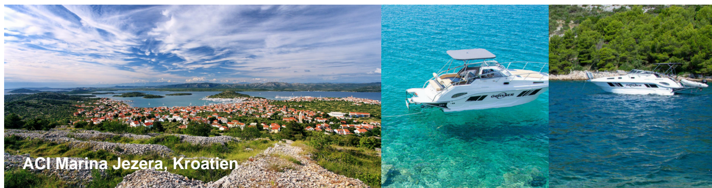
ACI Marina Jezera, Kroatien