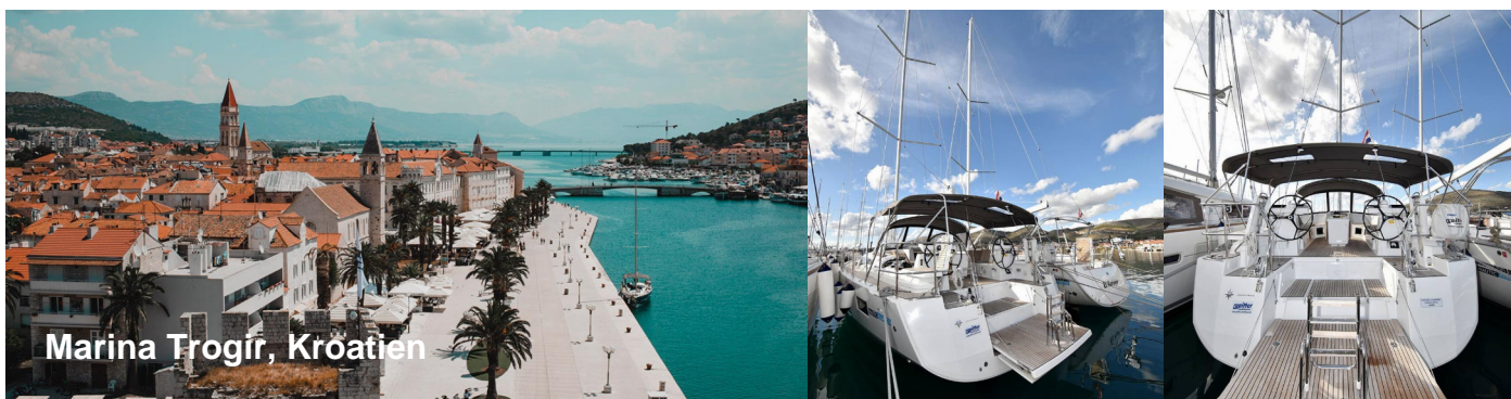
Marina Trogir, Kroatien