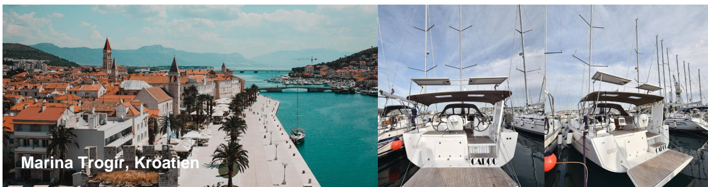
Marina Trogir, Kroatien