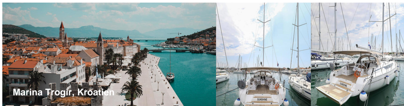
Marina Trogir, Kroatien