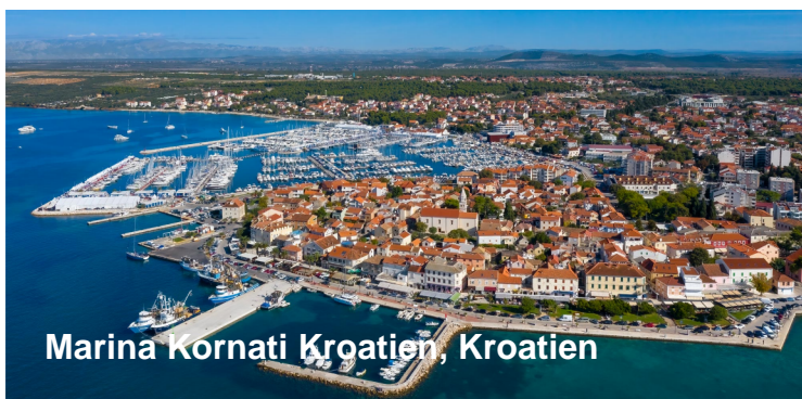
Marina Kornati Kroatien, Kroatien