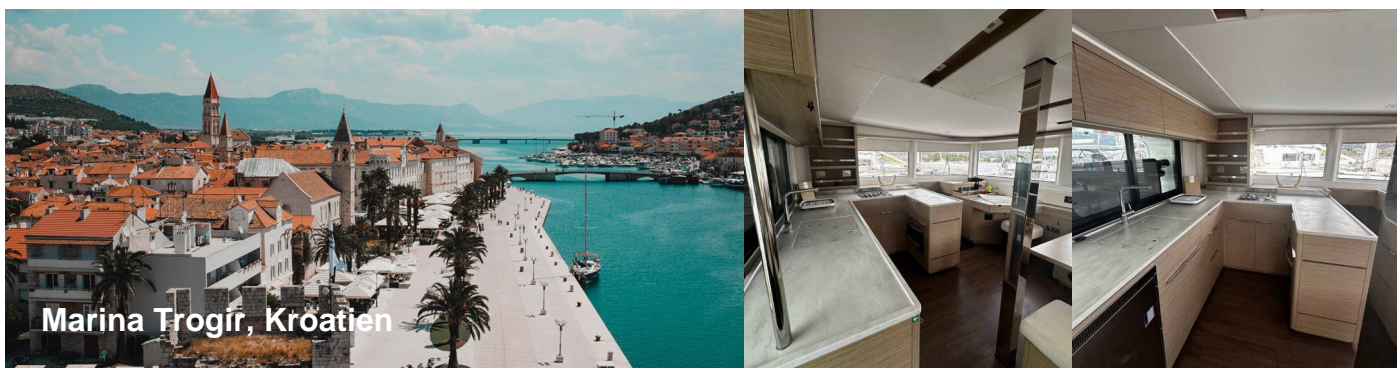
Marina Trogir, Kroatien