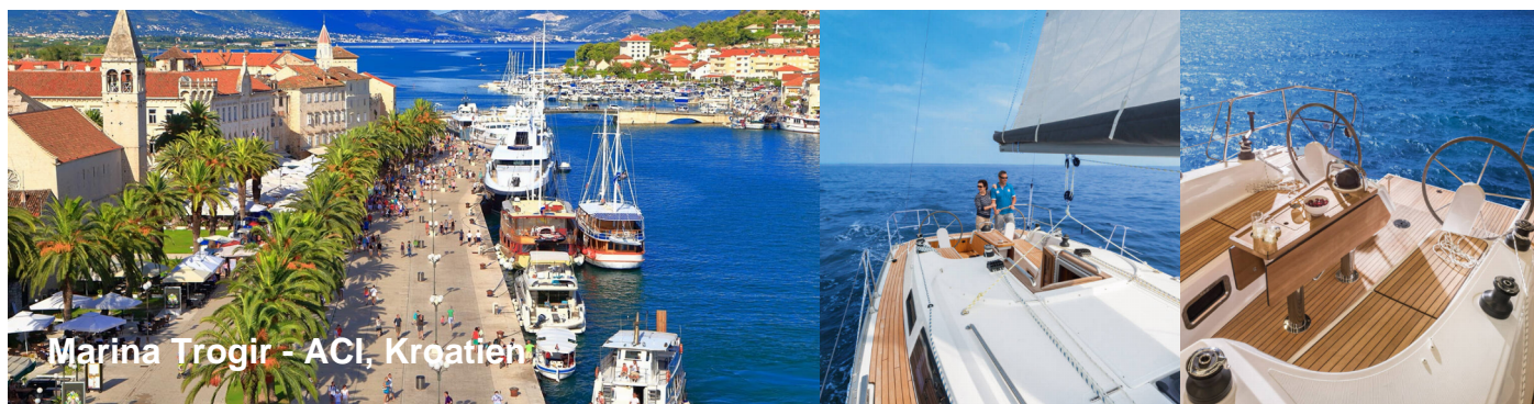
Marina Trogir - ACI, Kroatien