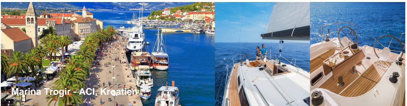
Marina Trogir - ACI, Kroatien