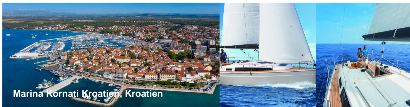
Marina Kornati Kroatien, Kroatien