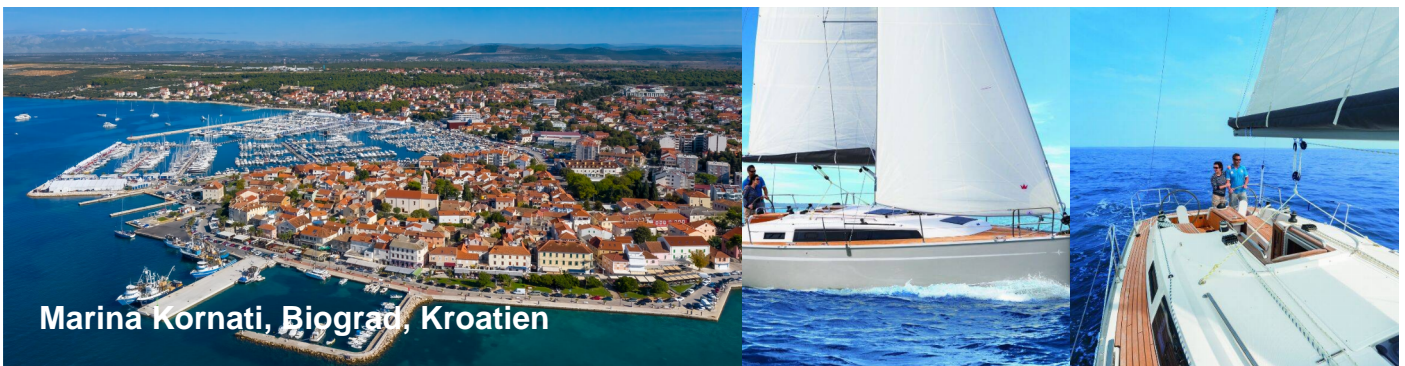
Marina Kornati, Biograd, Kroatien