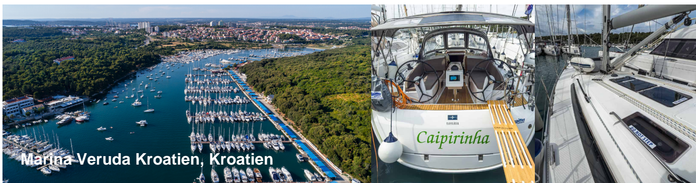
Marina Veruda Kroatien, Kroatien