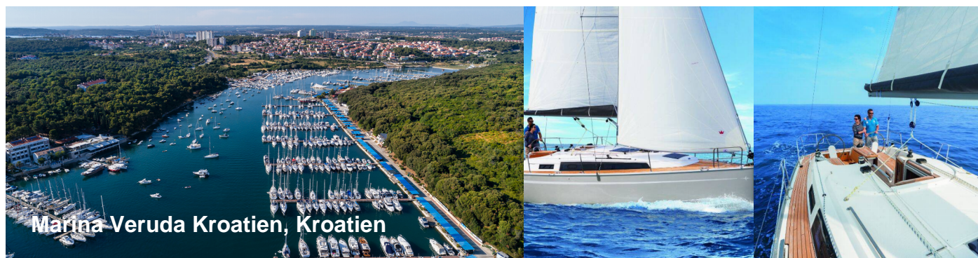
Marina Veruda Kroatien, Kroatien