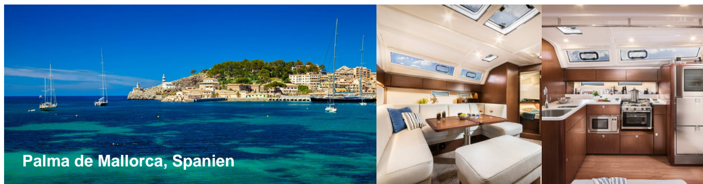
Palma de Mallorca, Spanien