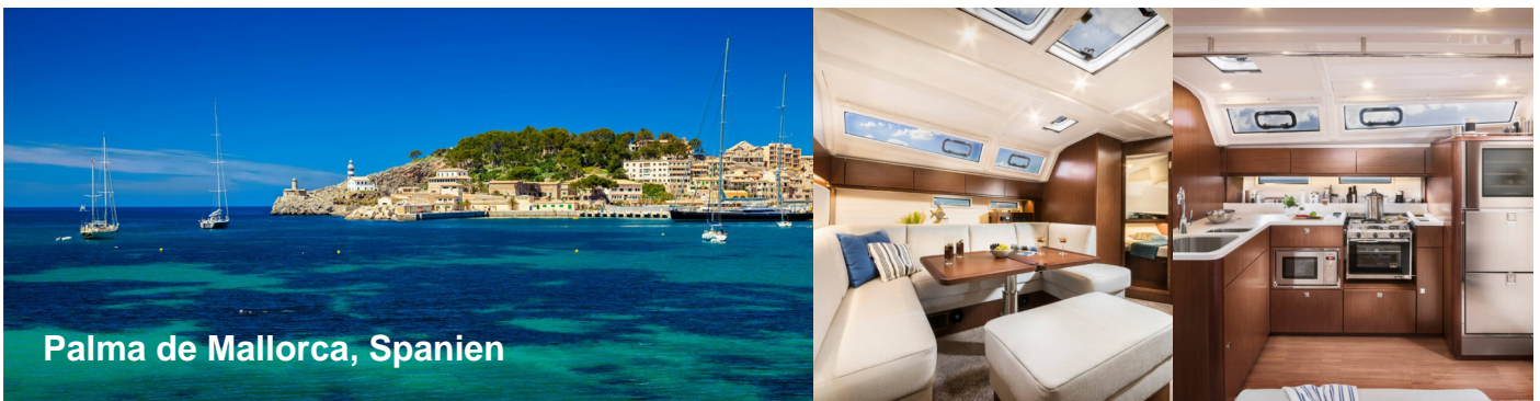
Palma de Mallorca, Spanien