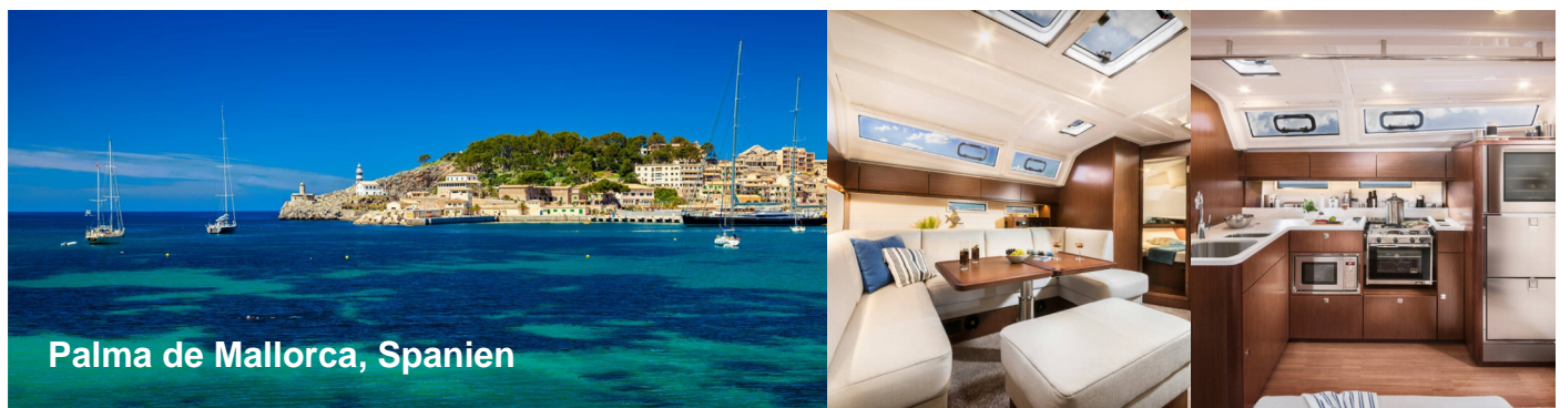
Palma de Mallorca, Spanien