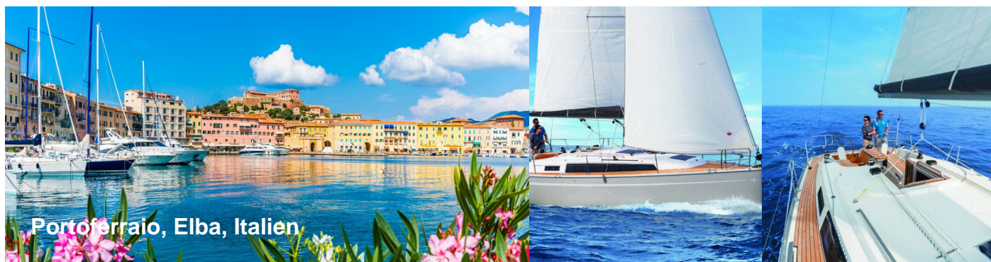
Portoferraio, Elba, Italien