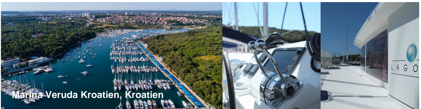
Marina-Veruda Kroatien, Kroatien