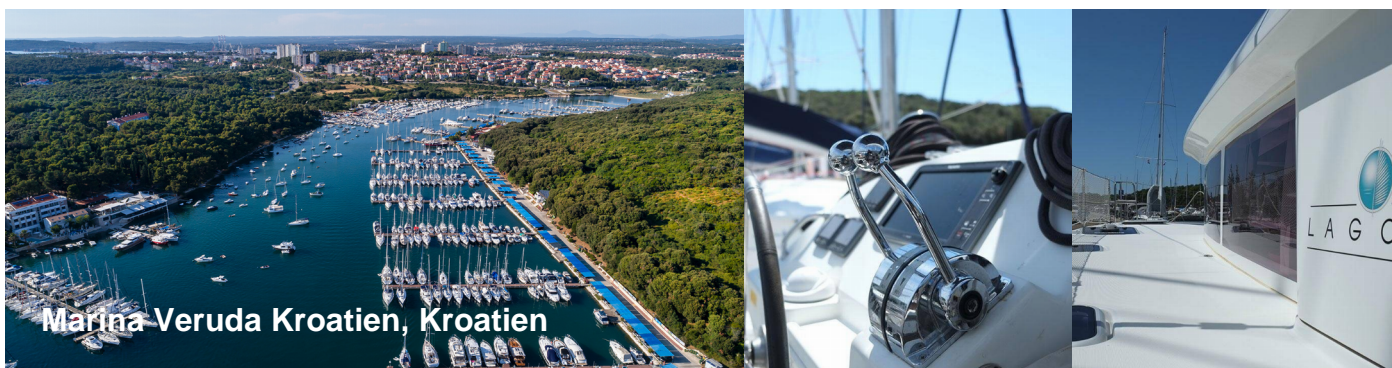
Marina-Veruda Kroatien, Kroatien