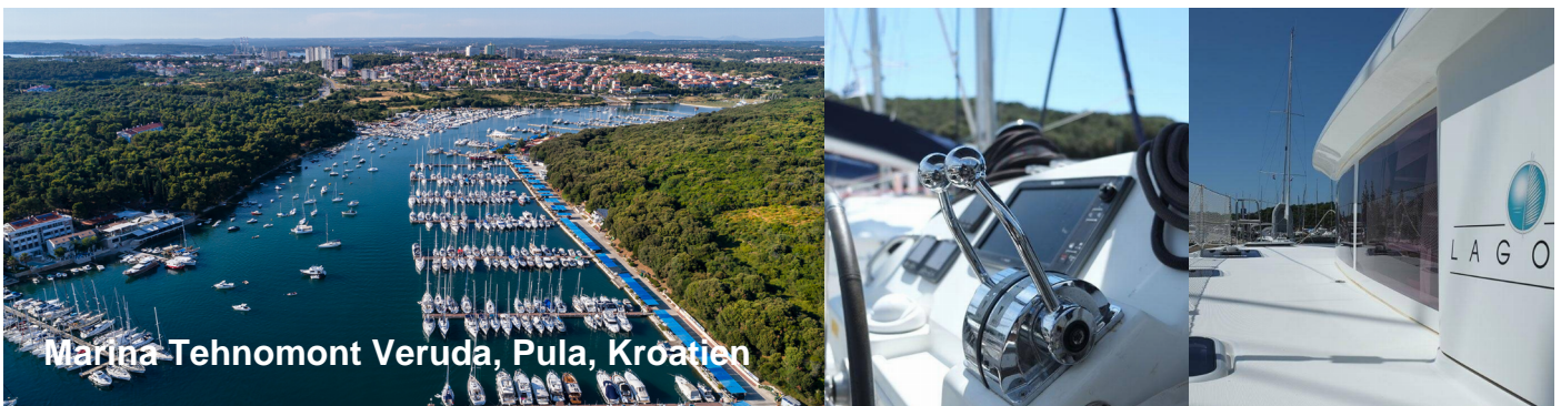
Marina Tehnomont Veruda, Pula, Kroatien