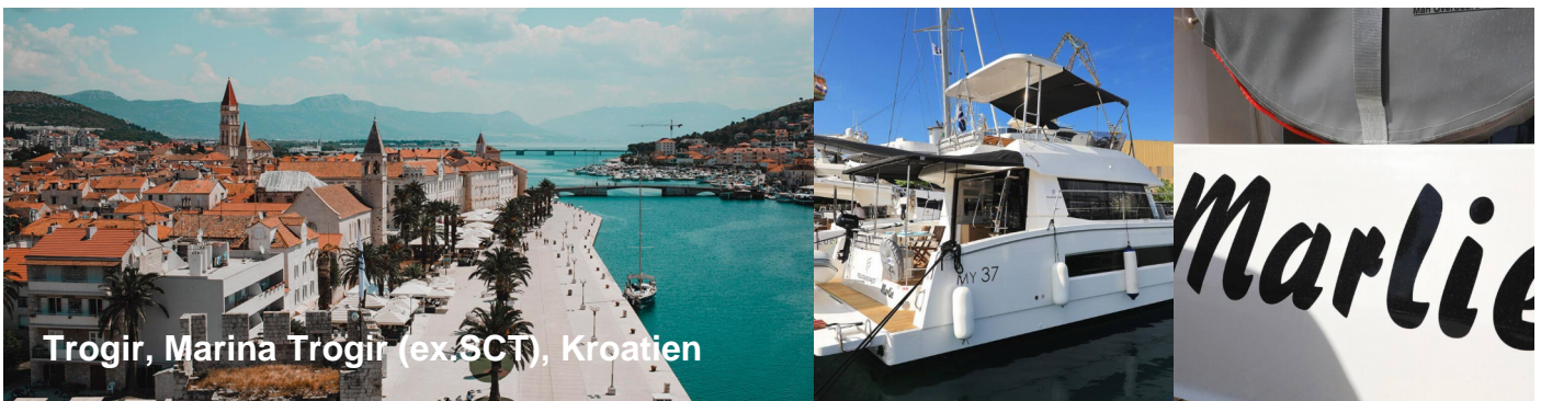
Trogir, Marina Trogir (ex-SCT), Kroatien