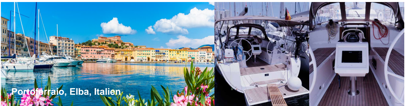
Portoferraio, Elba, Italien