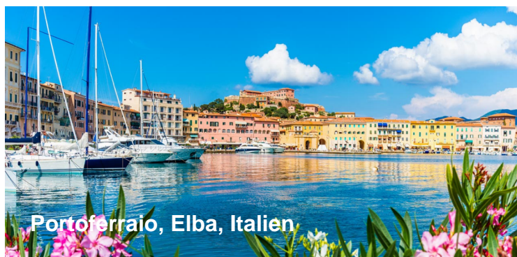
Portoferraio, Elba, Italien