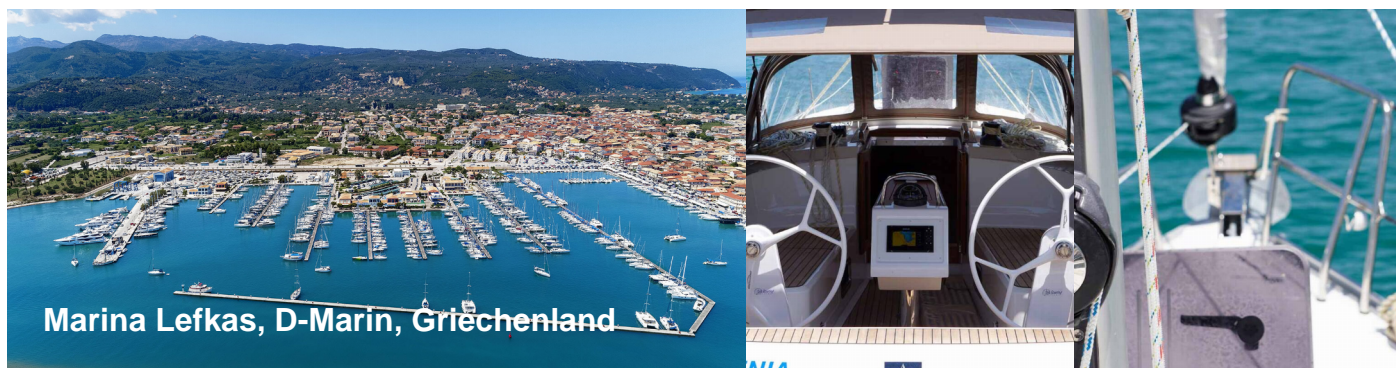
Marina Lefkas, D-Marin, Griechenland