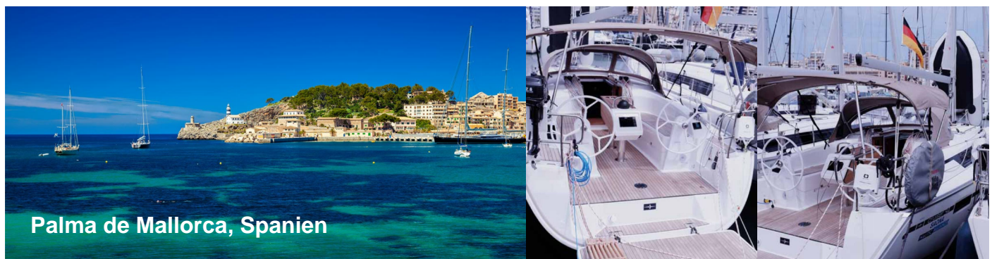
Palma de Mallorca, Spanien