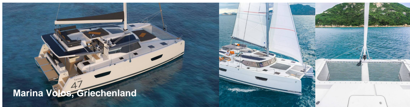
Marina Volos, Griechenland