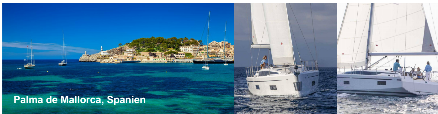
Palma de Mallorca, Spanien