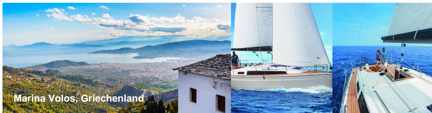
Marina Volos, Griechenland