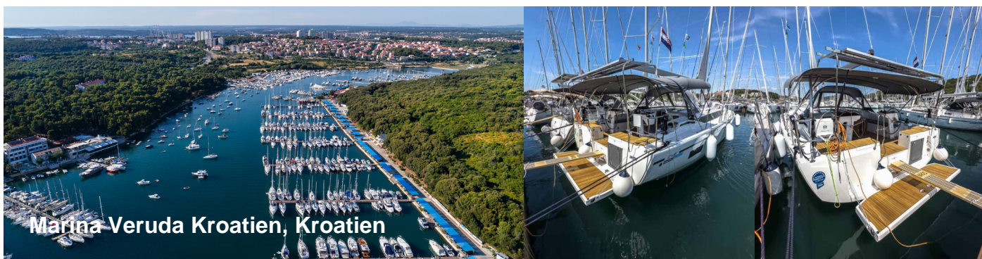
Marina Veruda Kroatien, Kroatien