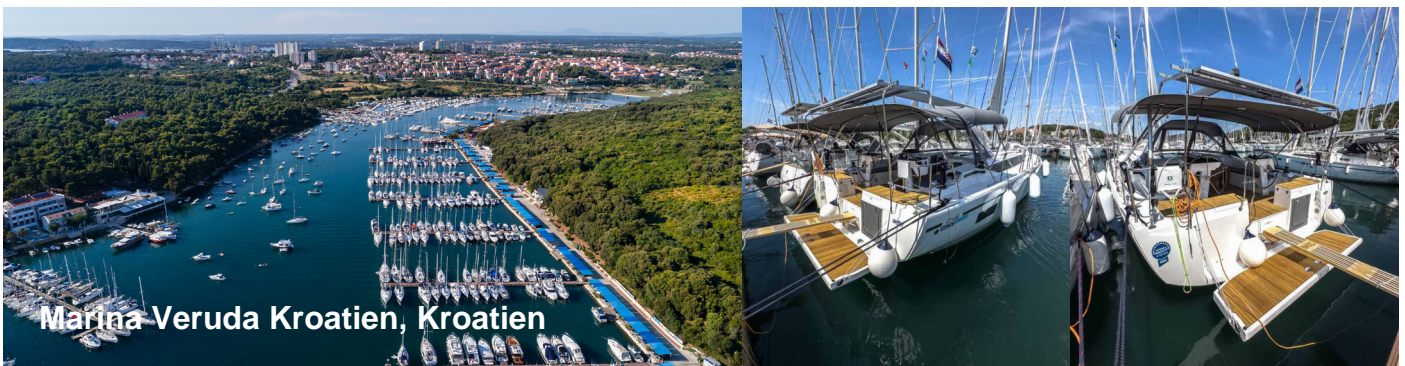
Marina Veruda Kroatien, Kroatien