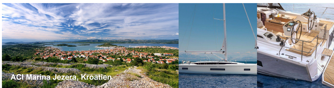
ACI Marina Jezera, Kroatien