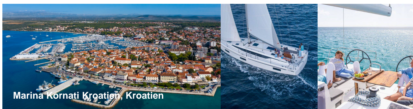
Marina Kornati Kroatien, Kroatien