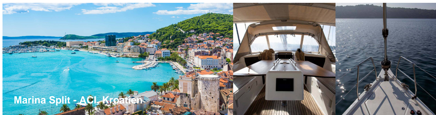
Marina Split - ACI, Kroatien