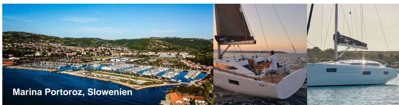
Marina Portoroz, Slowenien