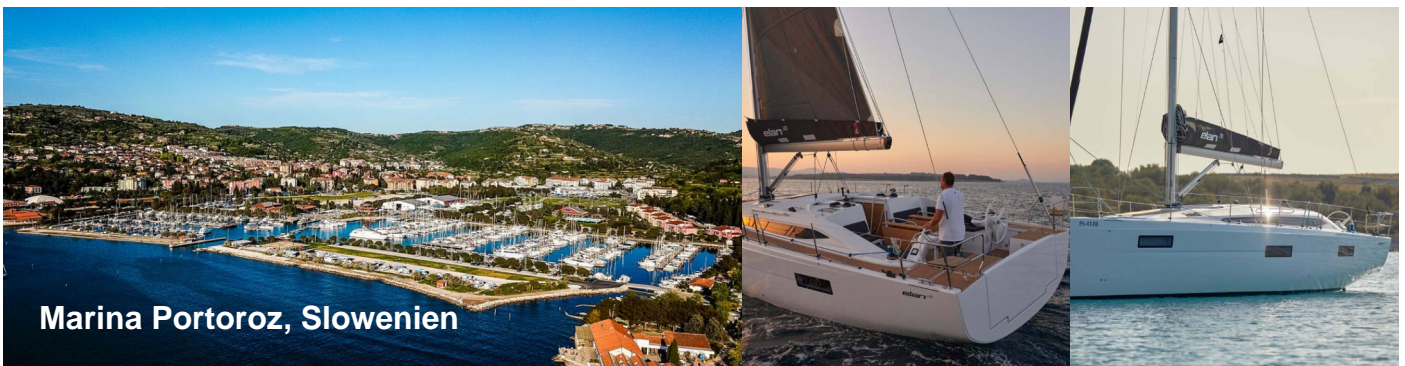
Marina Portoroz, Slowenien