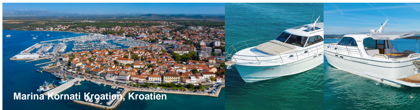
Marina Kornati Kroatien, Kroatien