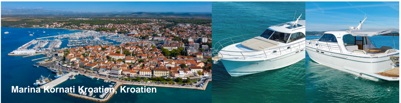
Marina Kornati Kroatien, Kroatien