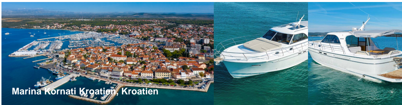
Marina Kornati Kroatien, Kroatien