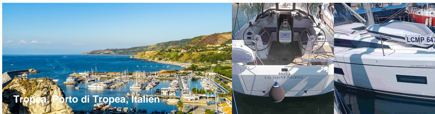
Tropea, Porto di Tropea, Italien