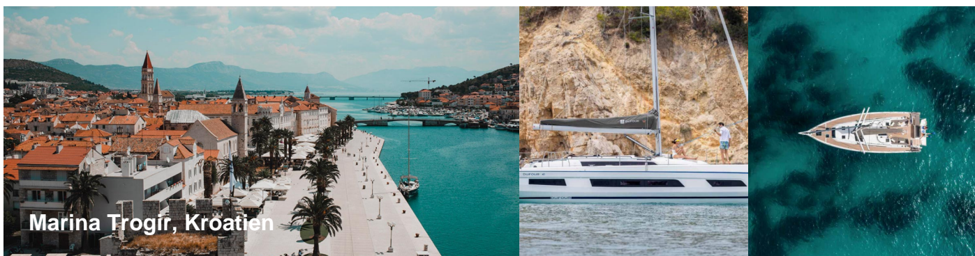
Marina Trogir, Kroatien