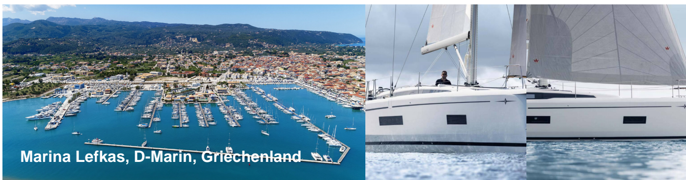
Marina Lefkas, D-Marin, Griechenland