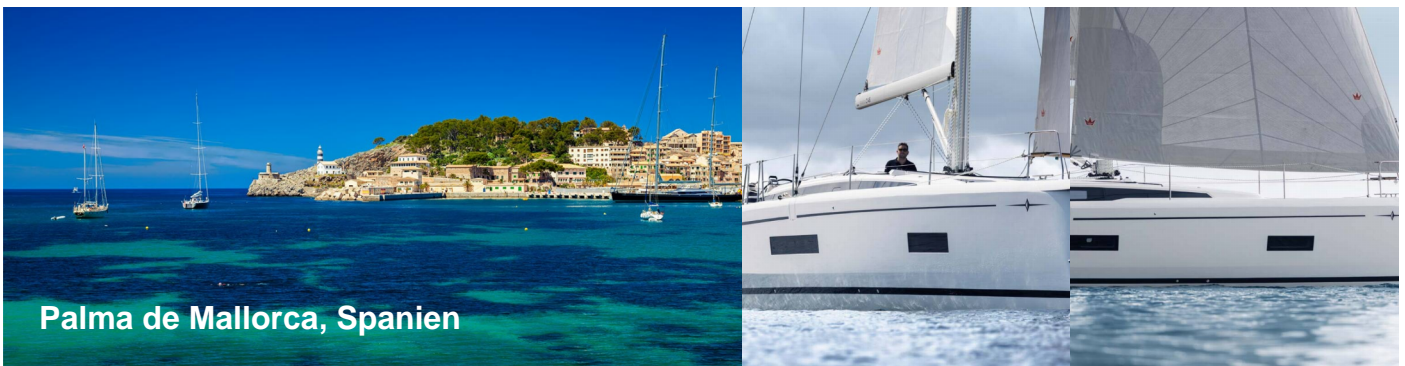
Palma de Mallorca, Spanien