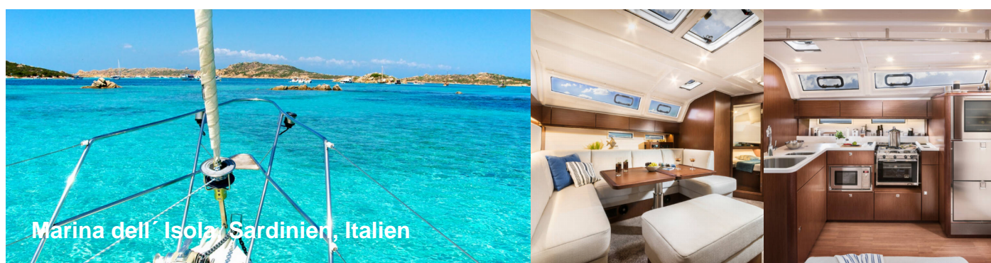
Marina dell' Isola Sardinien, Italien