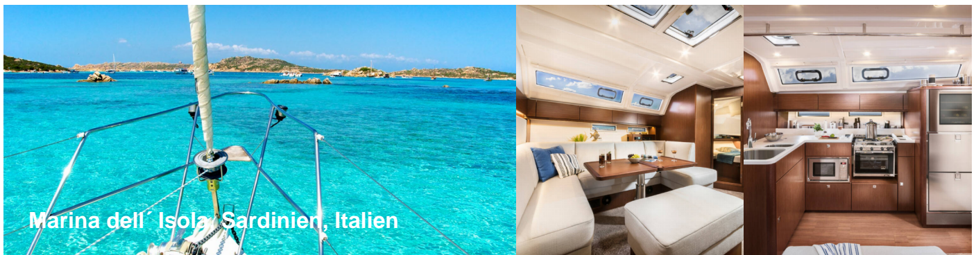
Marina dell' Isola Sardinien, Italien