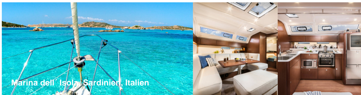
Marina dell' Isola Sardinien, Italien