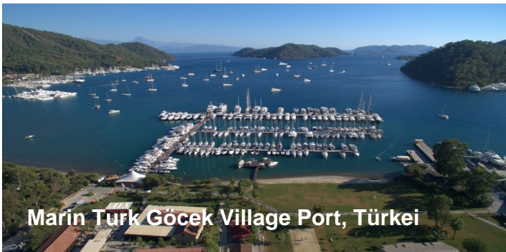
Marın Türk Göcek Village Port, Türkei