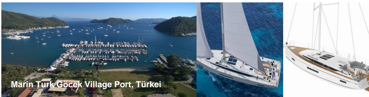
Marin Türk Göcek Village Port, Türkei