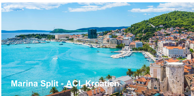
Marina Split - ACI, Kroatien