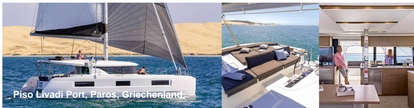
Piso Livadi Port, Paros, Griechenland