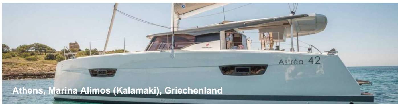
Athens, Marina Alimos (Kalamaki), Griechenland