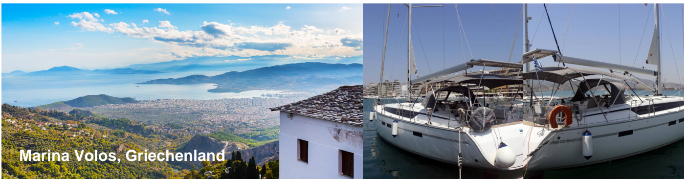
Marina Volos, Griechenland