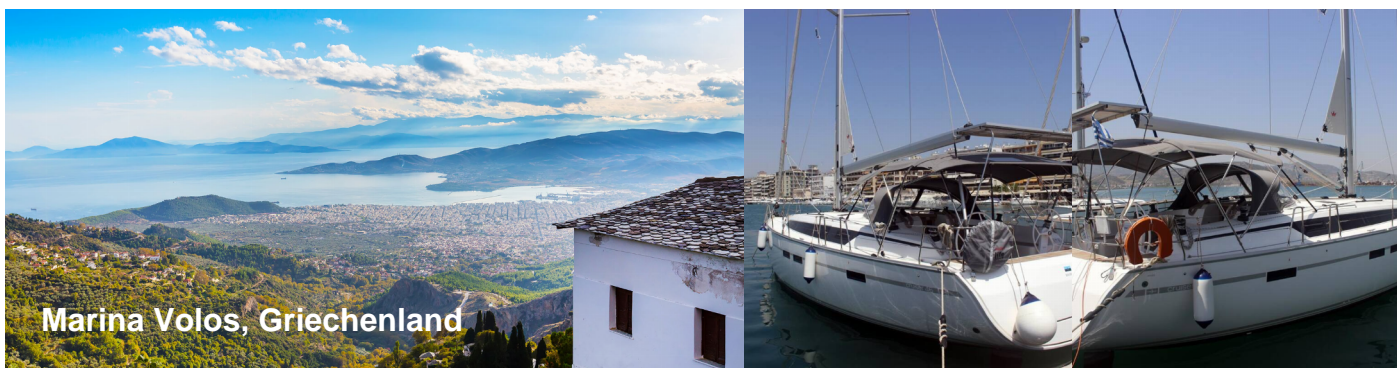
Marina Volos, Griechenland