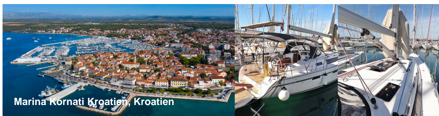
Marina Kornati Kroatien, Kroatien