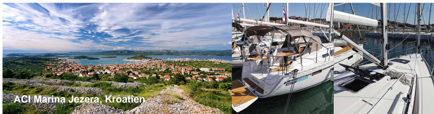
ACI Marina Jezera, Kroatien