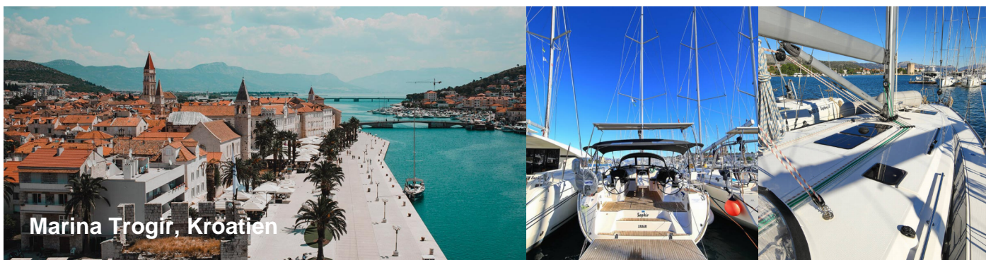
Marina Trogir, Kroatien