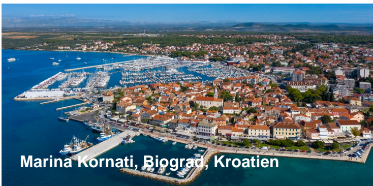
Marina Kornati, Biograd, Kroatien