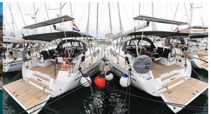
Marina Kornati Kroatien, Kroatien