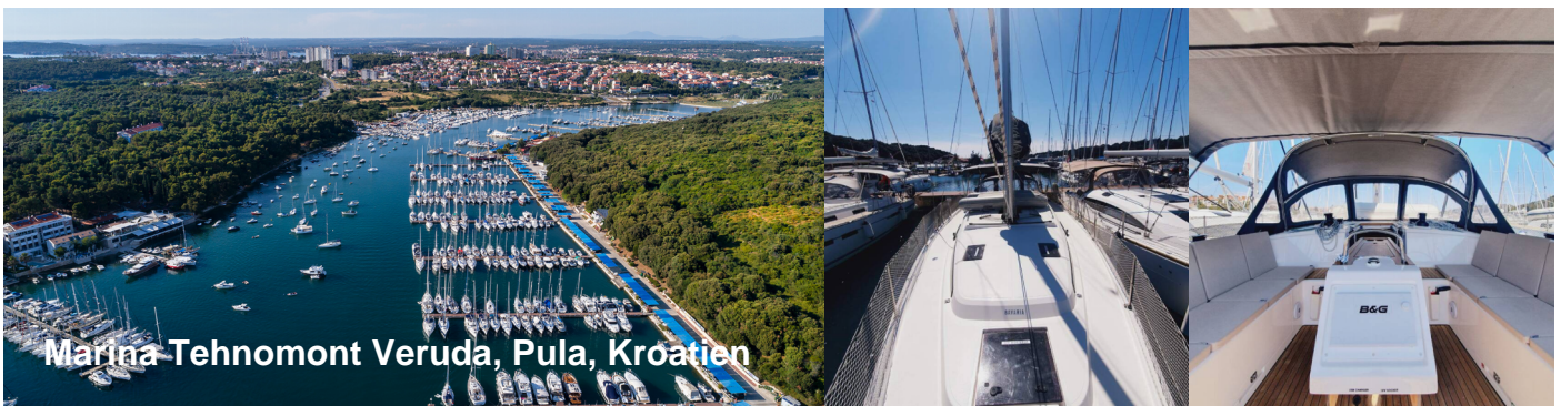
Marina Tehnomont Veruda, Pula, Kroatien