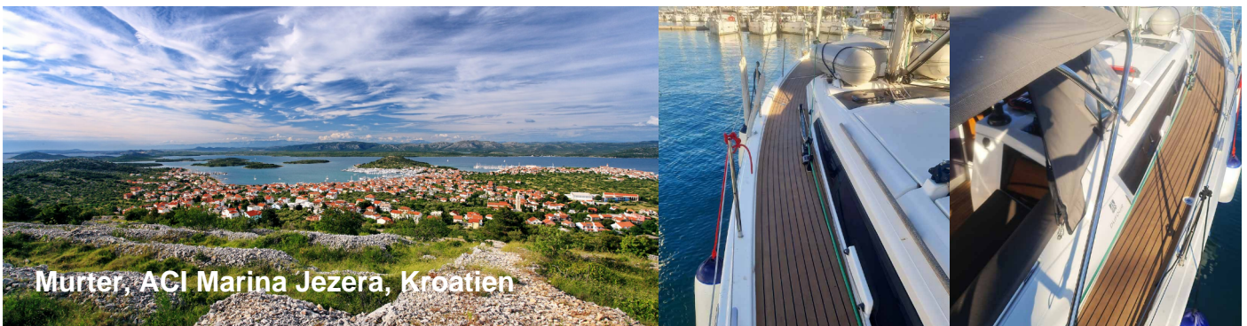
Murter, ACI Marina Jezera, Kroatien