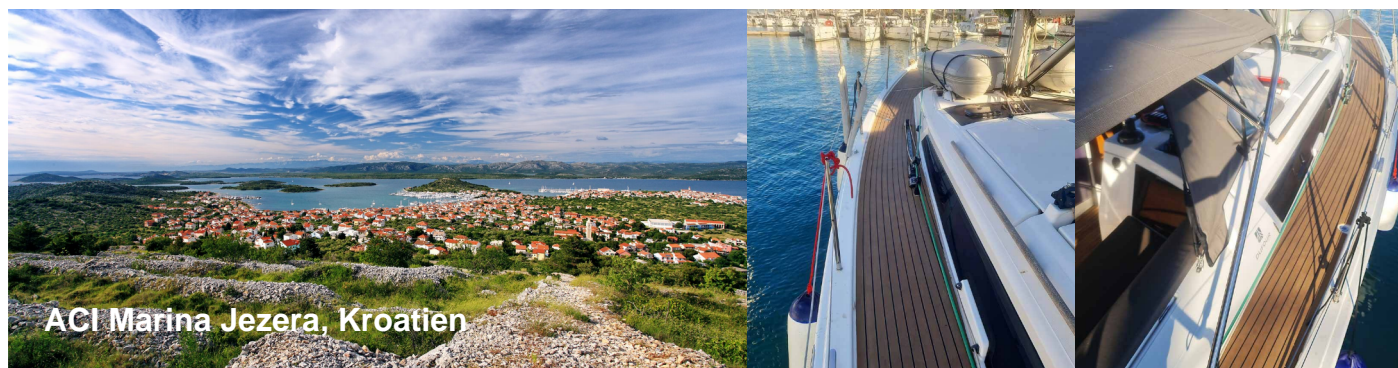
ACI Marina Jezera, Kroatien