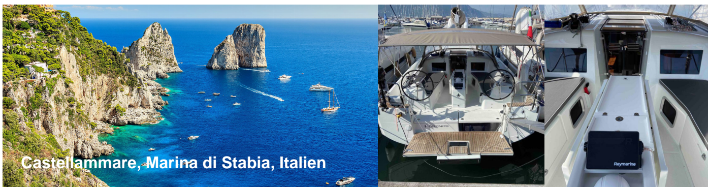
Castellammare, Marina di Stabia, Italien