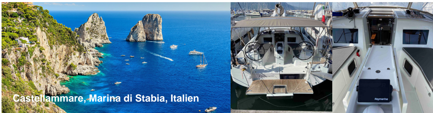
Castellammare, Marina di Stabia, Italien