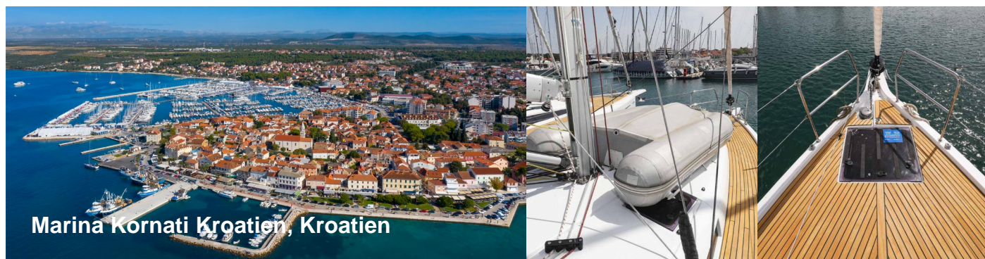
Marina Kornati Kroatien, Kroatien