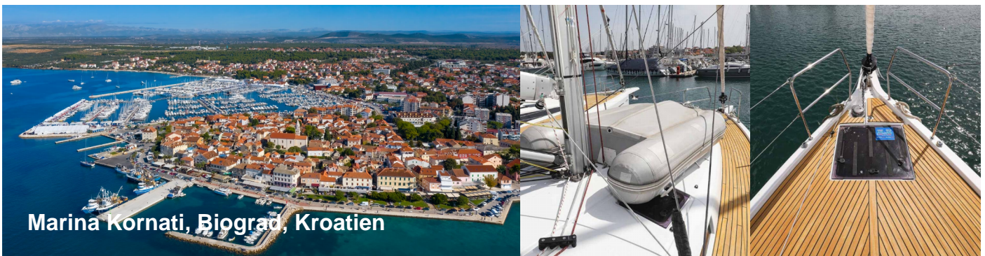
Marina Kornati, Biograd, Kroatien