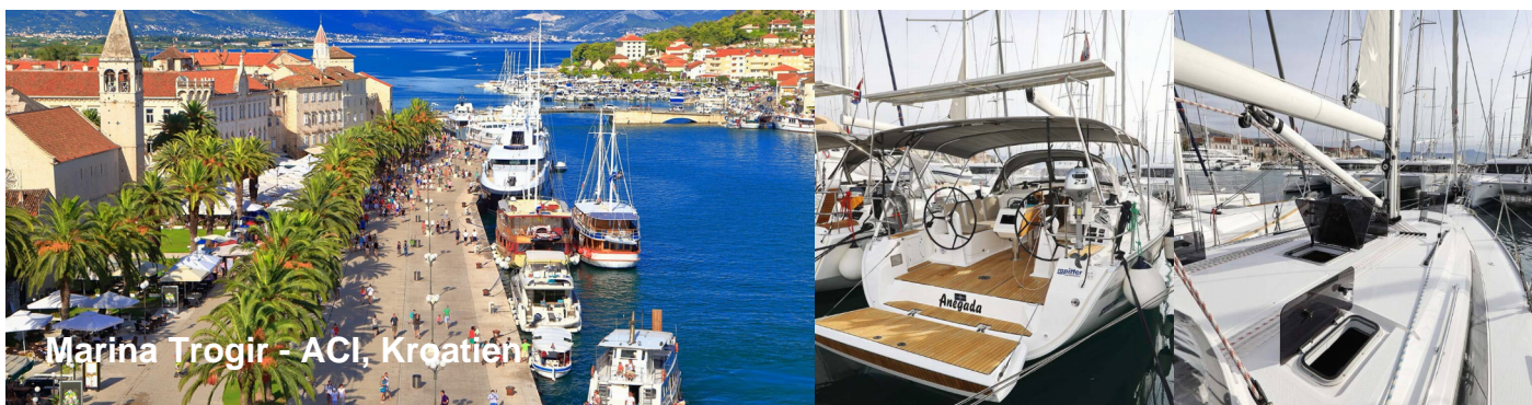
Marina Trogir - ACI, Kroatien