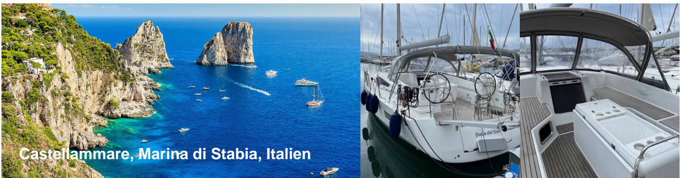
Castellammare, Marina di Stabia, Italien