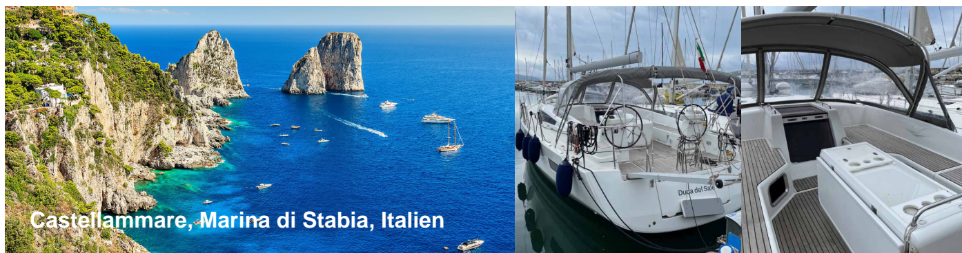
Castellammare, Marina di Stabia, Italien