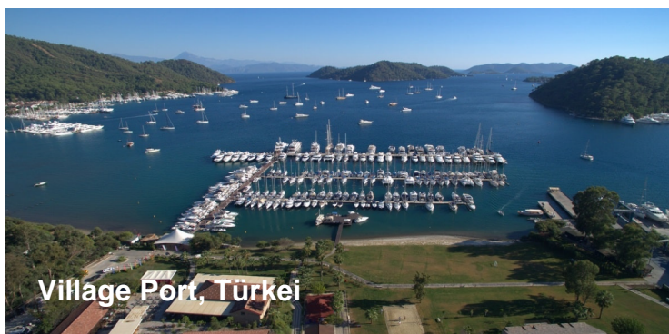
Village Port, Türkei