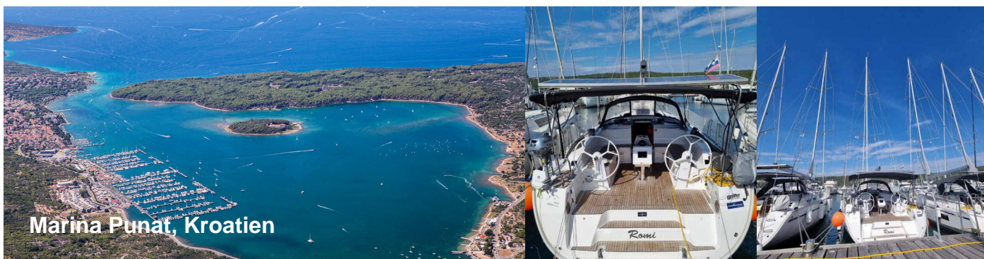
Marina Punat, Kroatien